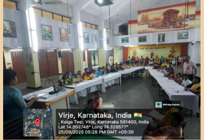
Virje, Karnataka, India Kaiga Twp, Virje, Karnataka 581400, India Lat 14.892748° Long 74.328577° 25/09/2025 05:28 PM GMT +05:30

ಸ್ವಚ್ಛ ಏವಂ ಹರಿತ ವಿದ್ಯಾಲಯ ರೇಟಿಂಗ್ (SHVR) ಯೋಜನೆಯ ಅಂಗವಾಗಿ 25 ಸೆಪ್ಟೆಂಬರ್ 2025 ರಂದು ಪ್ರಾಥಮಿಕ ಹಾಗೂ ಪ್ರೌಢ ವಿಭಾಗದ ವಿದ್ಯಾರ್ಥಿಗಳನ್ನು ಒಳಗೊಂಡ ಬಾಲ ಸಂಸತ್ ಅನ್ನು ರಚಿಸಲಾಯಿತು. ವಿದ್ಯಾರ್ಥಿಗಳು ಸಂಸತ್ ಸದಸ್ಯರು ಹಾಗೂ ಕೇಂದ್ರ ಸಚಿವರ ಪಾತ್ರಗಳನ್ನು ಉತ್ತಾಹದಿಂದ ನಿರ್ವಹಿಸಿ, ನಾಯಕತ್ವ, ಜವಾಬ್ದಾರಿ ಮತ್ತು ತಂಡದ ಕಾರ್ಯವನ್ನು ಸಾಂಕೇತಿಕವಾಗಿ ಪ್ರದರ್ಶಿಸಿದರು. ಶಾಲೆಯಲ್ಲಿ ಸ್ವಚ್ಛತೆ, ನೈರ್ಮಲ್ಯ ಮತ್ತು ಪರಿಸರ ಜಾಗೃತಿಯನ್ನು ಉತ್ತೇಜಿಸುವಲ್ಲಿ ಬಾಲ ಸಂಸತ್ ಪ್ರಮುಖ ಪಾತ್ರವಹಿಸುತ್ತದೆ. ಸ್ವಚ್ಛತಾ ಅಭಿಯಾನಗಳನ್ನು ಆಯೋಜಿಸುವುದು, ಸ್ವಚ್ಛತೆಯನ್ನು ಕಾಪಾಡುವುದು ಮತ್ತು ಪೋಸ್ಟರ್, ಚಾರ್ಟ್‌ಗಳು ಹಾಗೂ ಅಭಿಯಾನಗಳ ಮೂಲಕ ಆರೋಗ್ಯ ಮತ್ತು ಸ್ವಚ್ಛತಾ ಸಂದೇಶಗಳನ್ನು ಹರಡುವುದು ಇದರ ಪ್ರಮುಖ ಕಾರ್ಯಗಳಾಗಿವೆ. ಈ ಉಪಕ್ರಮವು ವಿದ್ಯಾರ್ಥಿಗಳ ಭಾಗವಹಿಸುವಿಕೆ ಮತ್ತು ಹೊಣೆಗಾರಿಕೆಯನ್ನು ಬೆಳೆಸಿ, ಸ್ವಚ್ಛ, ಹಸಿರು ಮತ್ತು ಆರೋಗ್ಯಕರ ಶಾಲಾ ವಾತಾವರಣ ನಿರ್ಮಾಣಕ್ಕೆ ಯುವ ಕಲಿಕಾರ್ಥಿಗಳನ್ನು ಸಕ್ರಿಯವಾಗಿ ತೊಡಗಿಸಿಕೊಳ್ಳುವಂತೆ ಮಾಡುತ್ತದೆ.