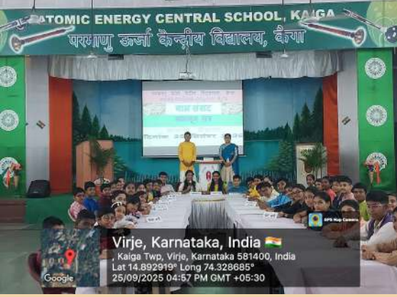
Virje, Karnataka, India Kaiga Twp, Virje, Karnataka 581400, India Lat 14.892919° Long 74.328685° 25/09/2025 04:57 PM GMT +05:30