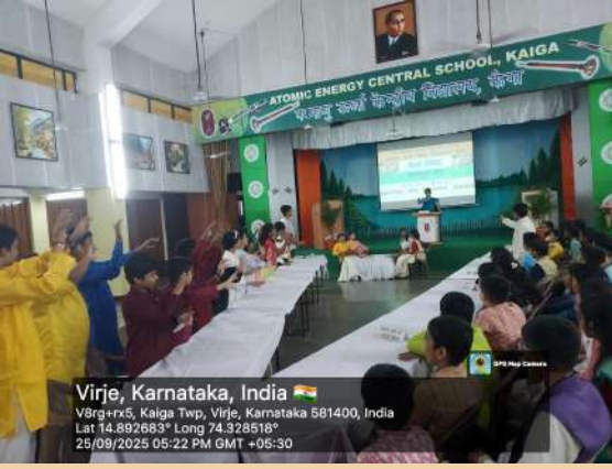
Virje, Karnataka, India V8rg+rx5, Kaiga Twp, Virje, Karnataka 581400, India Lat 14.892683° Long 74.328518° 25/09/2025 05:22 PM GMT +05:30